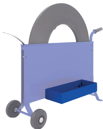
Ablagekastenpaar Twin tray