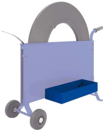
Ablagekastenpaar Twin tray