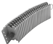
central® PP gestapelt, offen, glatt central® PP stacked, open, even